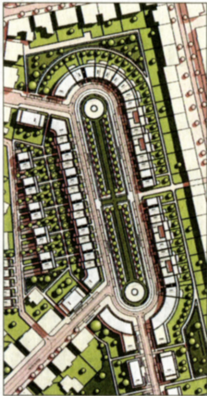
St. Leonhards Garten. Skizze: Brenner

Römischer Platz als Vorbild für das künftige Braunschweiger Baugebiet Leonhards Garten